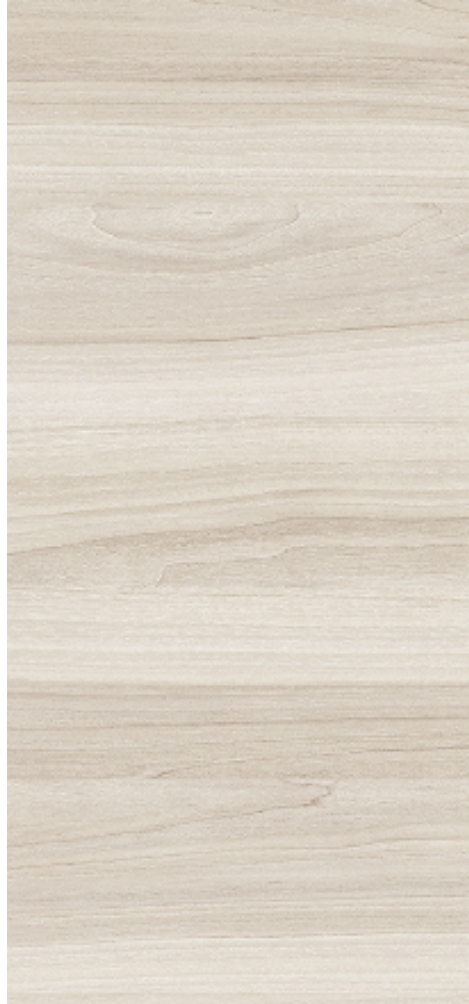
MADERA Revestimiento interior muro y cielo