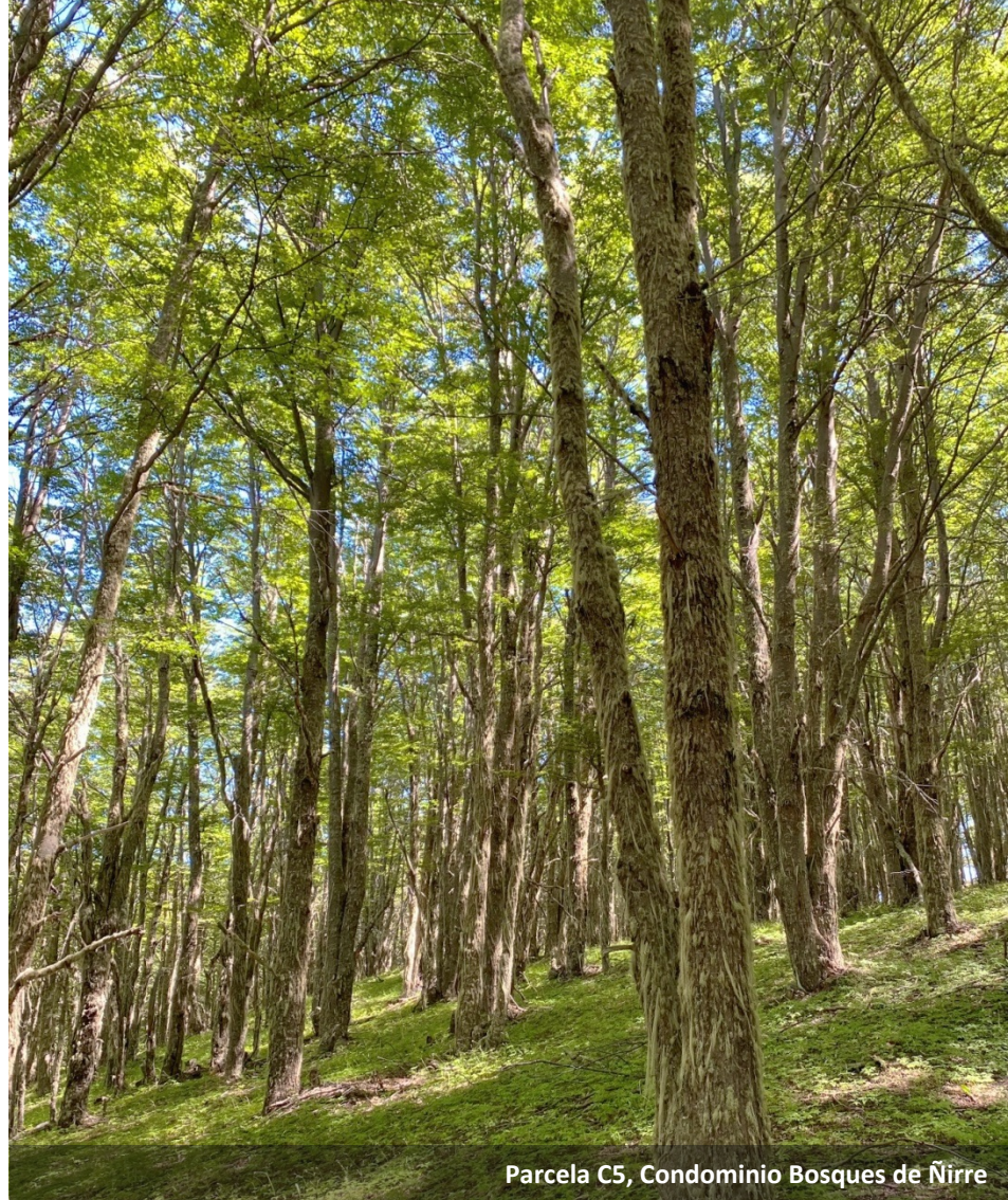
Parcela C5, Condominio Bosques de Ñirre

Descubre uno de los últimos lugares más salvajes del planeta, en una casa refugio diseñada y pensada con todas las comodidades necesarias para disfrutar de Bosques de Ñirre y su entorno.