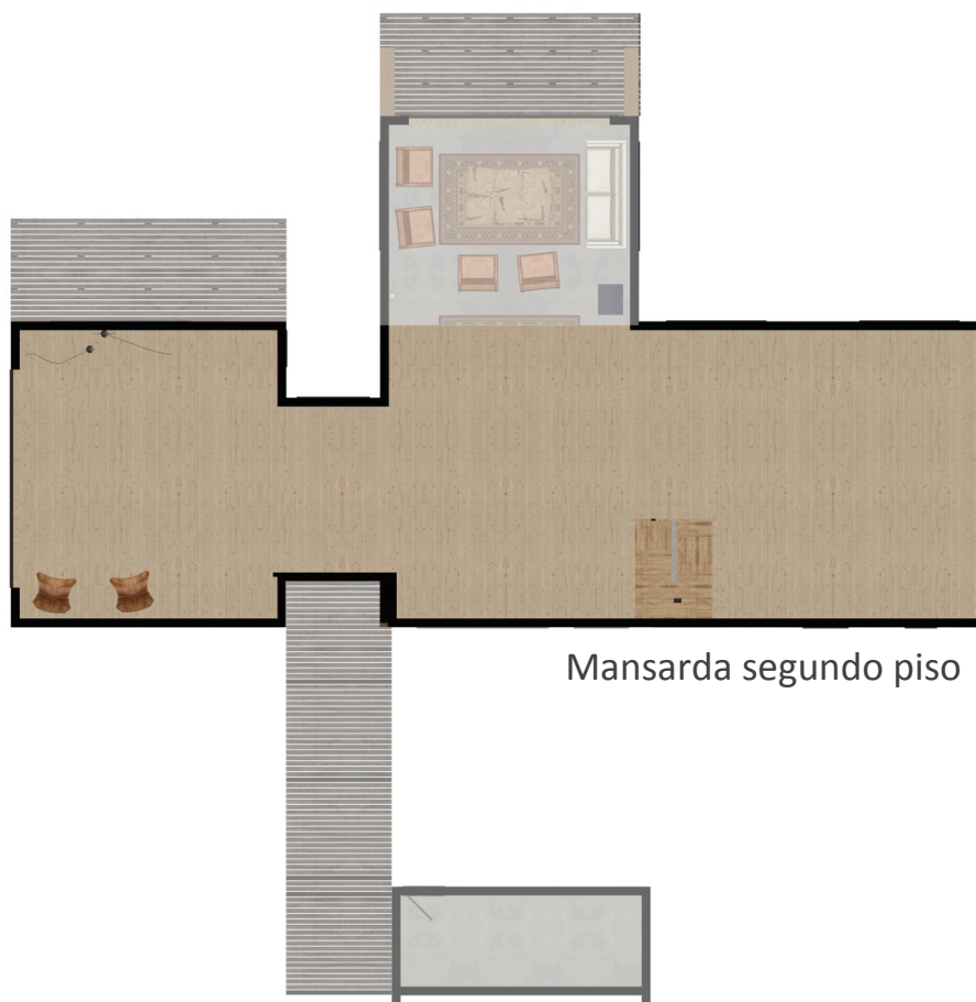
Mansarda segundo piso