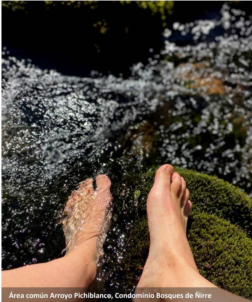
Área común Arroyo Pichiblanco, Condominio Bosques de Ñirre