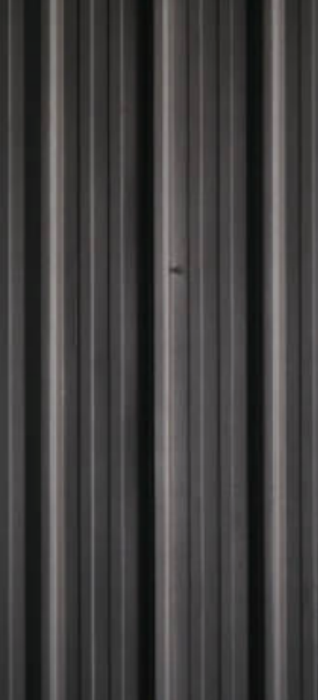
ZINC NEGRO ACANALADO Revestimiento exterior