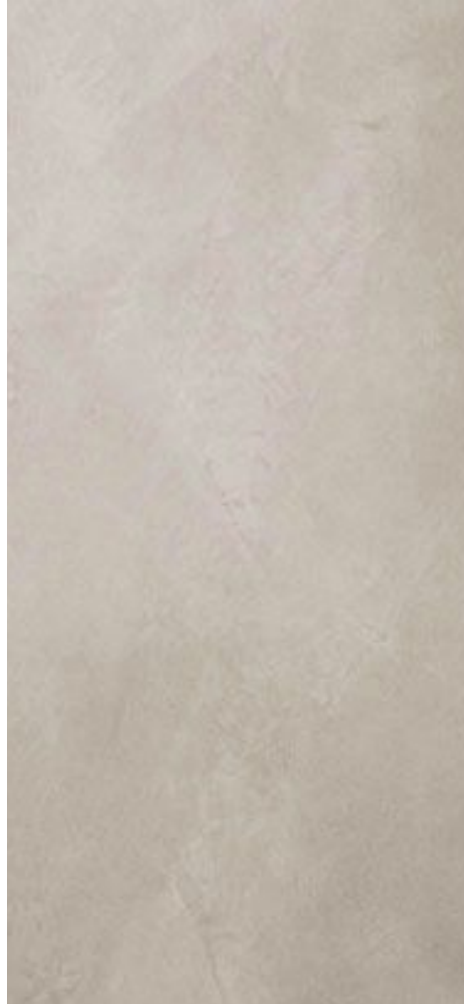
CEMENTO PULIDO Pavimento interior